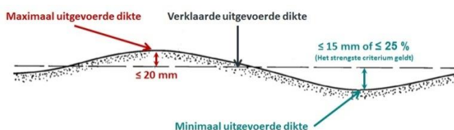
Fig. 1 Bepaling van de verklaarde uitgevoerde dikte

Opmerking: Deze bepaling van de gemiddelde dikte, d_G , stemt overeen met EN 14315-2:2013, Bijlage A, A.1, paragrafen 2 en 3, met aanvullende voorzieningen.